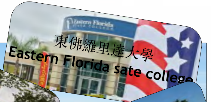
東佛羅里達大學 Eastern Florida state college