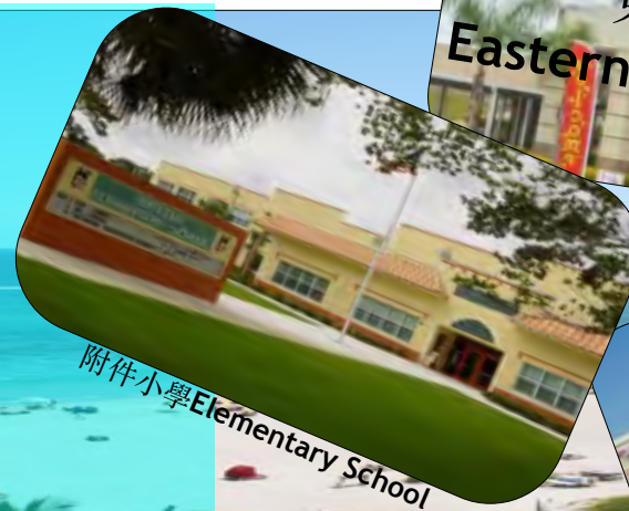
附件小學 Elementary School

Within 5 minutes to: Primary schools, Kindergartens, Shopping malls, 7-Eleven store, Banking, Supermarkets and all types of dinning.