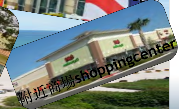
附近商場 shopping center